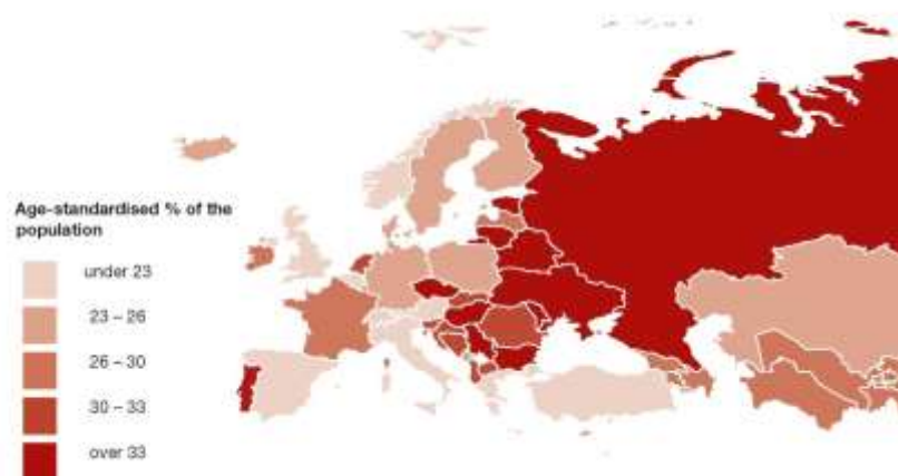
Prevalence of raised blood pressure aged +18, females, 2014, Europe