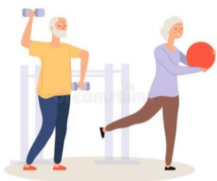
Exerciții fizice sau sport