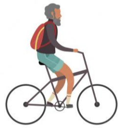
Mers cu bicicleta