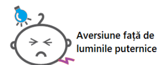
Aversiune față de luminile puternice