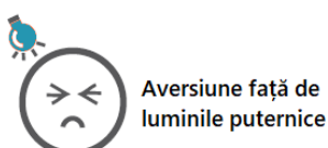
Aversiune față de luminile puternice