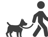
Plimbare cu cainele