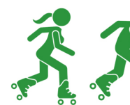
Mers cu rolele