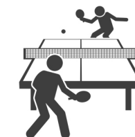
Tenis de masa