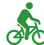
Mers cu bicicleta