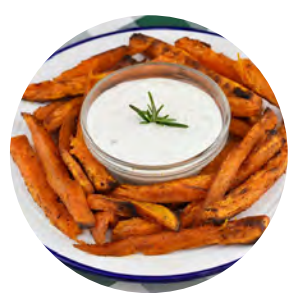
Cartofi dulci copti cu sos de iaurt