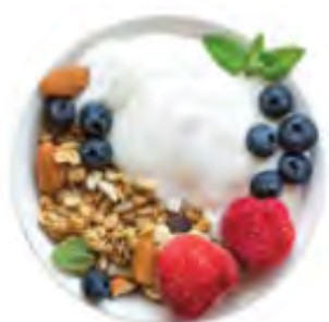
Iaurt cu fructe și semințe