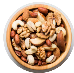
Diverse nuci sau semințe

Alimentele sănătoase conțin nutrienți care sunt importanți pentru creștere și dezvoltare în timpul pubertății