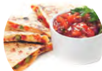
Lipie cu legume