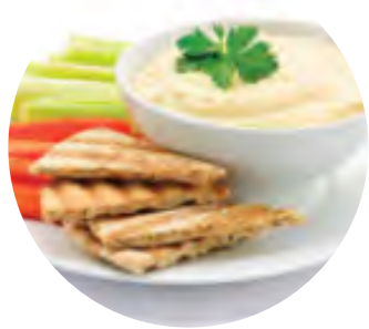
Bastonașe de legume cu humus